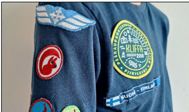
Ilmalippukunnan perhepartiollaisen oikea hiha.

Perhepartiossa merkit kannattaa kiinnittää partiohuiviin, ruokailupussiin, partioviittaan, lakkiin tai muuhun partiossa lapsen mukana kulkevaan vaatteeseen. Perhepartiollaisella voi olla myös oma tummansininen pitkähihainen partiopaita, t-paita, college tai huppari. Paitaan kiinnitetään merkkejä sudenpentupaidan tapaan. Merkkejä ovat esimerkiksi ilmapartiosiivet sekä paikkakunnan, lippukunnan, piirin ja SP:n tunnukset.