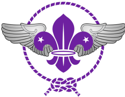
Ilmapartion kansainvälinen tunnus

Ilmapartiolla on kansainvälinen tunnus, joka perustuu maailmanjärjestö WOSM:n merkkiin.