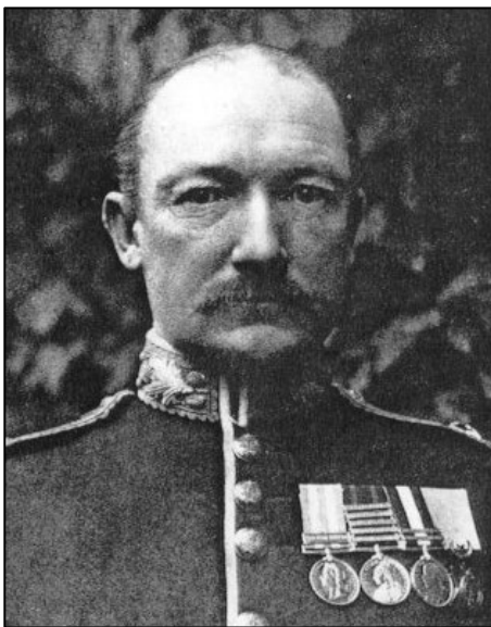
Ilmapartion perustaja Baden Baden-Powell (1860–1937) oli B-P:n nuorin veli.

Ilmapartiotoiminnan alussa keskeinen henkilö oli koko partioliikkeen perustajan Robert Baden-Powellin nuorin veli majuri Baden Powell. Hän oli kiinnostunut ilmailusta jo 1800-luvun puolella tehden kokeita leijoilla ja ilmapalloilla. Baden Baden-Powell toimi myös Royal Aeronautical Society n puheenjohtajana 1900-luvun ensimmäisellä vuosikymmenellä. Hän toi aktiivisesti ilmailua ja lentämistä mukaan käynnistyvään partiotoimintaan, minkä johdosta häntä pidetään ilmapartion perustajana.